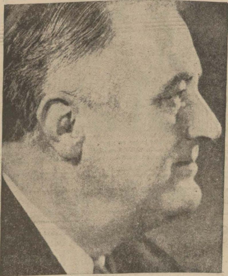
Amerika cumhurbaşkanı Ruzvelt

“Amerikanın müdafaası için elzem olan sulara sokulacak bütün mihver gemileri batırılacaktır,, “Amerikan gemileri plân dahilinde taarruzlara uğrayorlar, artık bu halin devamına müsaade etmiyeceğiz,,